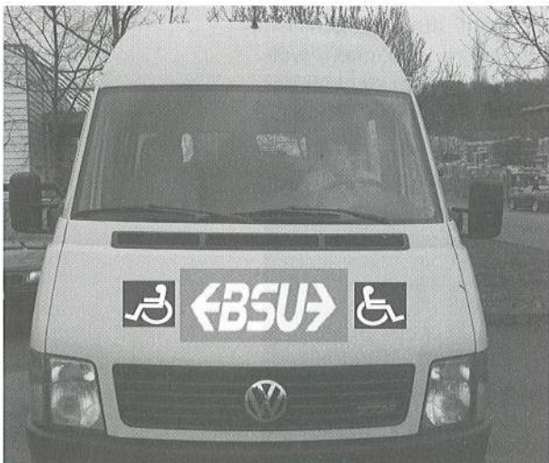
Vision oder Illusion?

Mehr als 100000 Franken – rund ein Achtel des Umsatzes, können wir als kleiner, lokal tätiger Verein nicht sammeln. Ohne weiter gehende Unterstützung durch die öffentliche Hand geht es entschieden nicht mehr weiter. Dafür muss nicht unbedingt Geld fließen. Wieso können nicht konzessionierte Transportunternehmungen die bisher von INVA MOBIL erbrachten Leistungen erbringen? Doppelspurigkeiten liessen sich vermeiden, Synergien könnten genutzt werden.