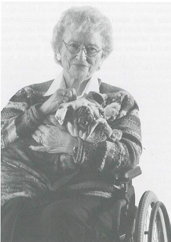
Ich freue mich, schon bald mit dem SOLIMOBIL unterwegs zu sein.

dass der Name nicht schon verwendet wird. Grossen Wert legte die Jury darauf, eine regionale Bindung herleiten zu können. Weiter soll der Name auch das Dienstleistungsangebot charakterisieren.