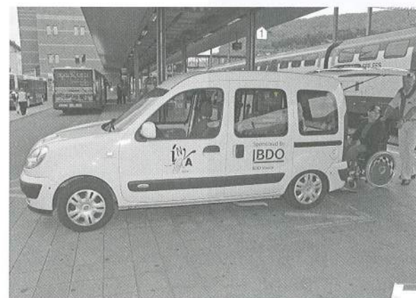
INVA MOBIL schliesst eine wichtige Lücke zwischen den verschiedenen Trägern des öffentlichen Verkehrs.

Mehr als ihren Beitrag leisten die Kunden und unsere Spender, Gönner und Sponsoren. Erstere, indem sie erhebliche Preise für die beanspruchten Dienstleistungen berappen. Kann man noch für einen Zweifränkler zwischen ein paar Stationen den Bus benutzen, geht bei uns für IV-Rentner und Betagte unter einem Zehnmötli nichts mehr. Und dass uns nicht schon lange der Schnauf ausgegangen ist, haben wir den vielen Freunden zu verdanken, welche uns regelmässig unterstützen. Dafür danken wir diesen an dieser Stelle herzlich.